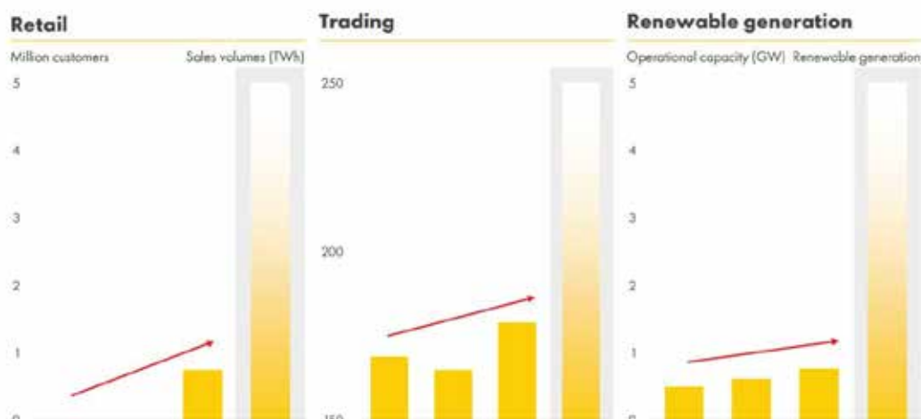
圖二 殼牌集團2025年發展目標

殼牌新能源對售電、再生能源、儲能系統及電動車充電領域之投資布局，已使集團轉型發展方向明確化，其具體體現於設定之2025年目標-零售電力用戶達5百萬及再生能源裝置容量5GW(如下圖二)。