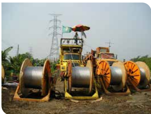
輸電線路延放作業時，重車工作人員操作之放線機