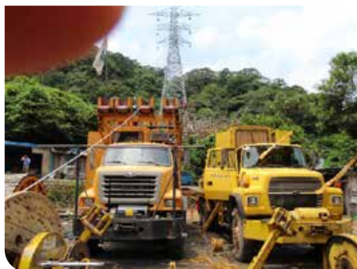
延放作業時，左為操作之放線車，右為副線車