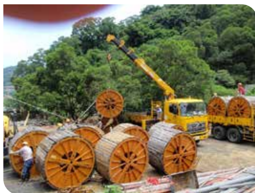
重車工作人員協助吊掛、佈置線卷軸