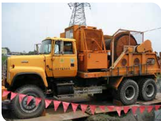
重車工作人員駕駛的輸電線路拉線機