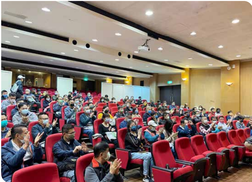
本會所屬第9屆分會常務理事及秘書