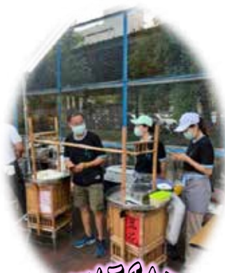
搶手的三千金豆花