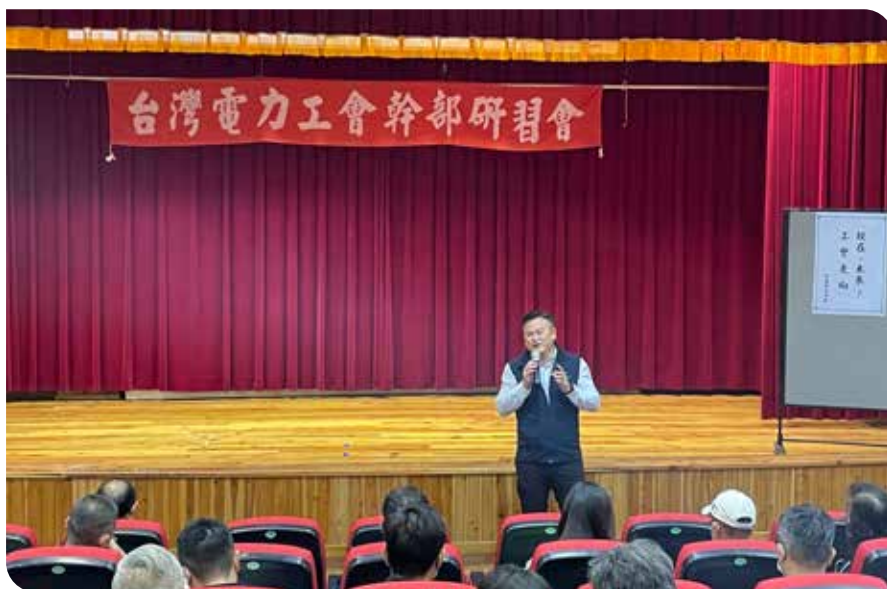
吳理事長分享近期工會會務