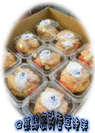
口感綿密的香草泡芙