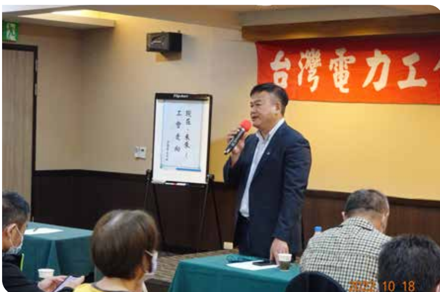
吳理事長分享近期工會會務