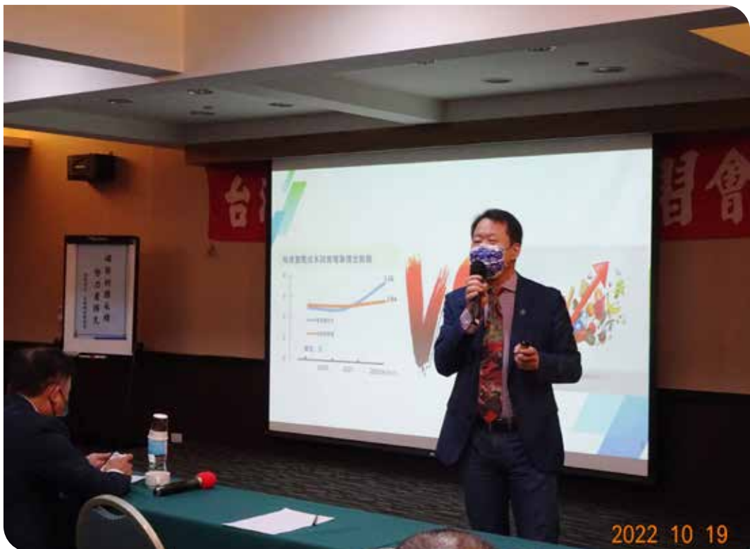
台電公司王振勇副總經理分享台電財務狀況